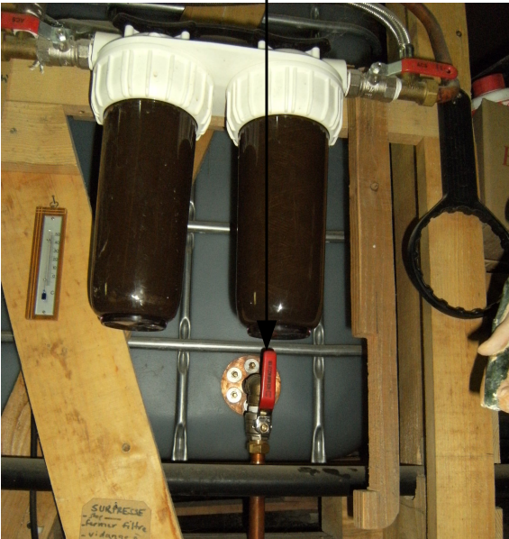
vanne 1 de crépine du réservoir